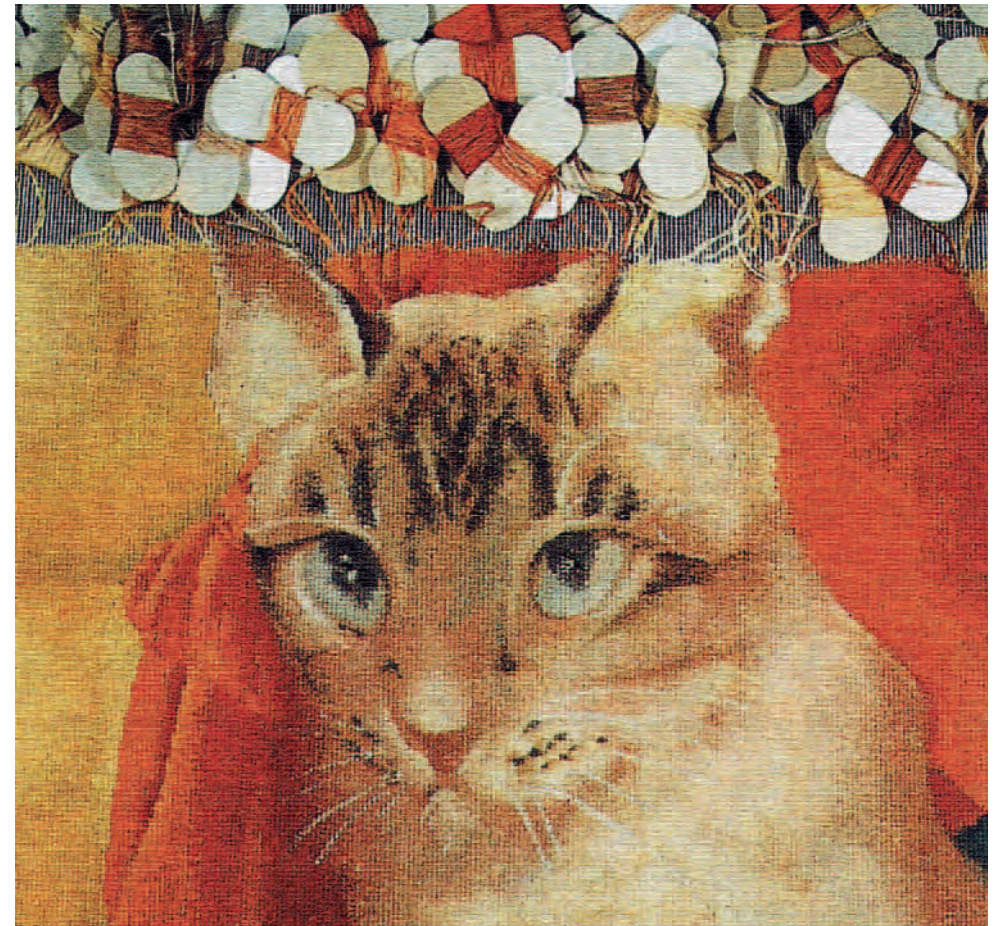
Entwurf von Jaroslava Pešicová, Umsetzung Gobelin Manufaktur Neuhaus

100 let Gobelínových dílen v Jindřichově Hradci (CZ)